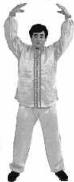
2 - 4