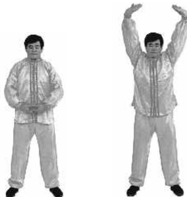
1 - 1

Lyft båda händerna med handflatorna pekande uppåt. Låt tumspetsarna röra vid varandra lätt, för ihop de andra fingrarna och överlappa händerna, vänster hand överst för män, höger hand överst för kvinnor, bilda en oval form, placera dem sedan framför nederdelen av buken. Håll överarmarna lätt framåt, håll armbågarna utåt så att det bildas hålrum under armhålorna (se fig. 1-1).