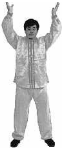
1 - 3