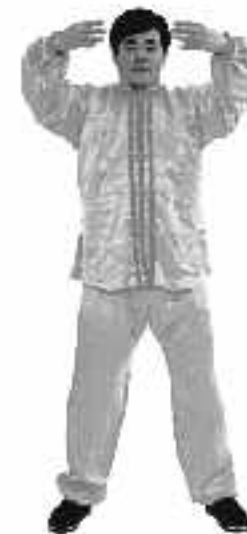
2 - 2