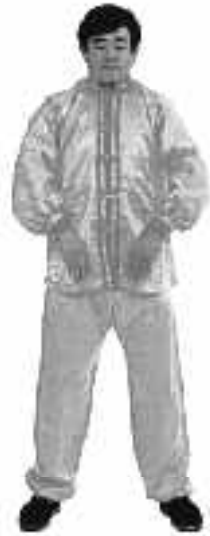
1 - 4