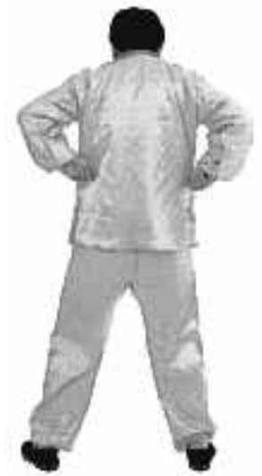
4 - 7

Under hela övningen Falun himmelska kretsloppet, låt inte händerna vidröra någon del av kroppen, för i så fall kommer energin i båda händerna att dras tillbaka in i kroppen. När händerna inte kan gå högre upp, slut händerna lätt och bilda en ihålig knytnäve (se fig. 4-7).