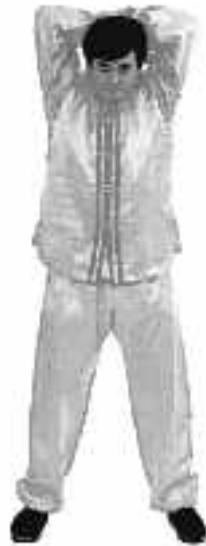
4 - 10