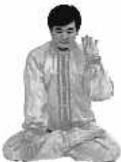
5 - 6