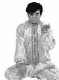
5 - 8