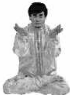
5 - 4

Separera därefter händerna, gör en cirkel ovanför huvudet och för händerna i sidled tills de når till framsidan av huvudet (se fig. 5-3).