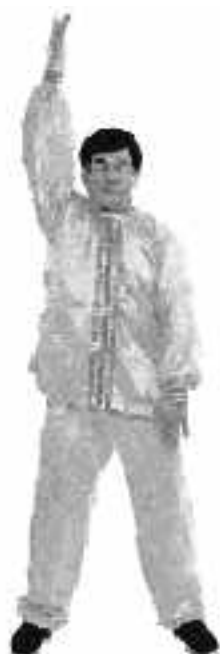
3 - 4