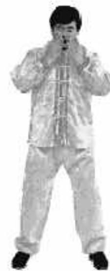
4 - 12