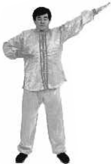
1 - 7