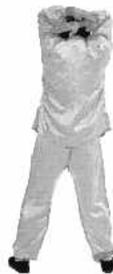
4 - 11