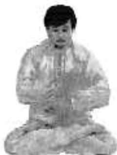
5 - 5

Ta ner båda händerna långsamt, håll armbågarna mot kroppen så nära som möjligt, vänd båda handflatorna uppåt med fingertopparna pekande framåt (se fig. 5-4). När båda händerna rätas ut, för dem i kors framför bröstkorgen, för män är den vänstra handen ytterst, för kvinnor är den högra handen ytterst (se fig. 5-5). Efter det att båda händerna har passerat i kors bildas en "rät linje", vänd den yttre handen först utåt och sedan åt sidan och uppåt, medan du vänder handflatan uppåt och gör en halvcirkel med fingertopparna pekande bakåt, gesten görs med avsevärd kraft. Efter det att inre handen har passerat i kors, för handflatan gradvis nedåt tills armen blir rak. Vänd sedan handflatan uppåt, låt handen och armen bilda en vinkel på 30 grader mot kroppen (se fig. 5-6).