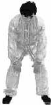
4 - 3