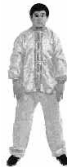
3 - 6