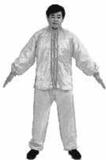
1 - 12