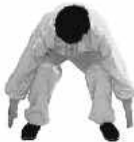
4 - 4

Ta isär händerna från Heshi-positionen, för dem nedåt till nederdelen av buken, vänd samtidigt handflatorna mot kroppen. Avståndet mellan händerna och kroppen ska vara c:a 10 cm, låt händerna passera utmed nederdelen av buken och för dem nedåt mellan benen, följ insidan av fötterna och böj dig samtidigt framåt och inta hukställning (se fig. 4-3).