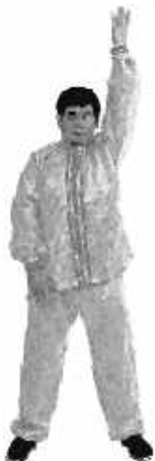
3 - 3