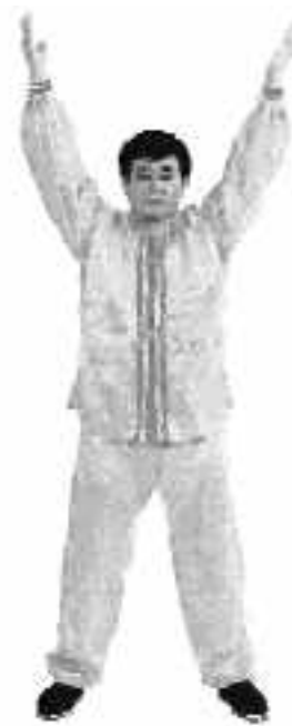
3 - 5