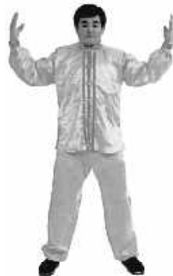
2 - 5