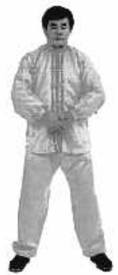
4 - 13

För sedan händerna framåt under armhålorna, korsarmarna framför bröstkorgen (det finns inget speciellt krav för vilken arm som är överst eller underst, följ din egen vana, samma för män och kvinnor) (se fig. 4-8), öppna de ihåliga knytnävarna, placera båda händerna ovanför axlarna (med ett mellanrum). Fortsätt med att föra händerna längs utsidan av armarna till handlederna, sedan följer handflatorna utsidan av armarna, när de kommer till handlederna, vänd händerna så att handflatorna är riktade mot varandra, dvs yttre tummen vänds uppåt och inre tummen vänds nedåt, håll ett avstånd på 3-4 cm mellan handflatorna, vid det här tillfället formas en rät linje med händerna och underarmarna (se fig. 4-9).