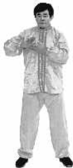
1 - 8

När den vänstra handen gradvis nått positionen, sträck hela kroppen gradvis, drag huvudet uppåt och pressa båda fötterna stadigt mot marken. Sträck den vänstra handen uppåt åt vänster. Den högra handen följer överarmen och sträcks utåt åt höger (se fig.1-7).