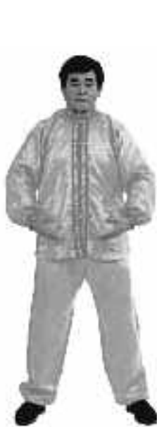
2 - 3