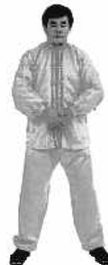
2 - 6