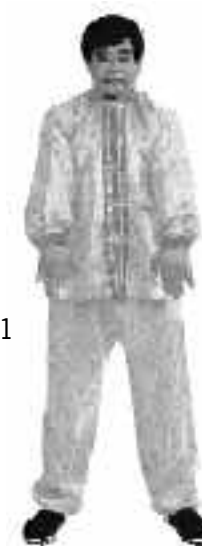
1 - 11