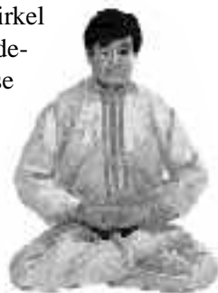
5 - 15

Fortsätt från föregående position, dra en halvcirkel med den övre handen från framsidan till nederdelen av buken, till Liangshou Jieyin-positionen (se fig. 5-15) och inträd i stilla kultiveringsövning. Träd in i inre stillhet, ju längre desto bättre.