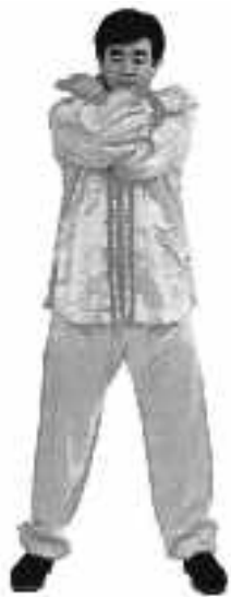
4 - 8