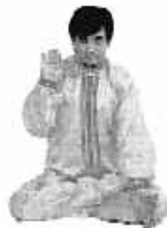
5 - 7