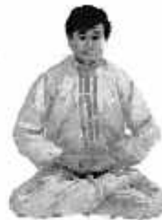
5 - 1

Sitt med korslagda ben, håll hela kroppen avslappnad men ej slapp, ryggen rak, nacken upprätt, drag in underkäken något, lyft tungspetsen mot hårda gommen med tänderna lätt isär, slut läpparna och ögonen lätt, barmhärtighet växer fram i hjärtat och inta ett fridfullt och harmoniskt uttryck. Liangshou ”Jieyin” vid nederdelen av buken och inträd gradvis i stillhet (se fig 5-1).