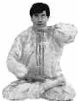
5 - 13