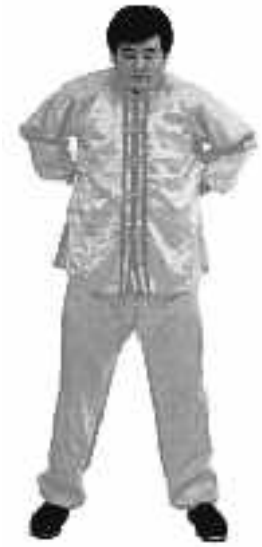
4 - 6

När fingertopparna är nära marken, för händerna från tåspetsarna och utsidan av foten som en cirkel till baksidan av hälen (se fig. 4-4).