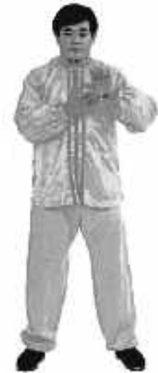
1 - 6