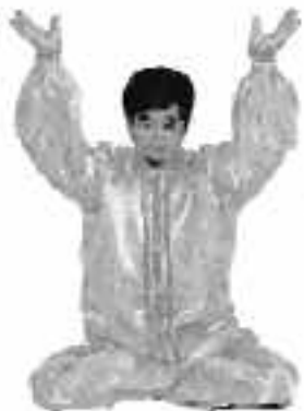
5 - 3