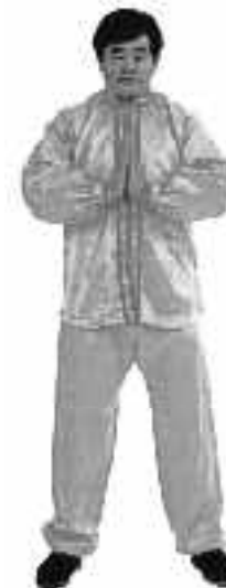
3 - 2