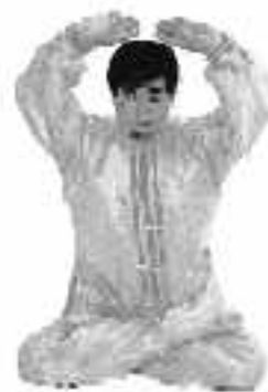
5 - 2

När man lyfter upp händerna följer hjärtat tanken med rörelser under ledning av qi-mekanismen insatt av Läraren. Rörelserna bör vara mjuka, långsamma och runda.