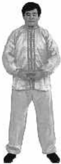
4 - 1