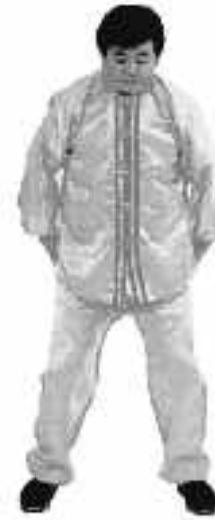
4 - 5