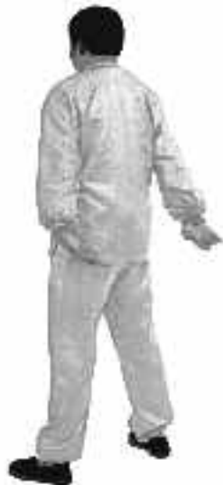
1 - 13