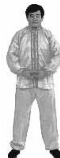
1 - 16