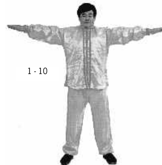
1 - 10

Börja med "Heshi", ta isär händerna och för dem snett framför kroppen rakt nedåt. När armarna är raka och parallella med varandra, bilda en vinkel på c:a 30 grader mot benen (se fig. 1-11). Sträck ut hela kroppen, dra huvudet uppåt och pressa båda fötterna stadigt mot marken, sträck c:a 2-3 sek., slappna av plötsligt i hela kroppen och för tillbaka händerna till "Heshi" framför bröstkorgen.