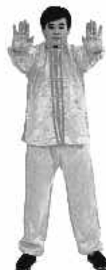
1 - 14

Börja med "Heshi". Ta isär händerna och för dem bakom kroppen med handflatorna vända bakåt. När båda händerna kommer bakom kroppens båda sidor, vinkla handflatorna bakom kroppen och bilda en vinkel på 45 grader (se fig.1-13). Sträck på hela kroppen gradvis. När händerna nått positionen, drag huvudet uppåt och håll fötterna stadigt på marken, håll kroppen rak, sträck c:a 2-3 sek., slappna av i hela kroppen plötsligt och för händerna tillbaka till "Heshi" framför bröstkorgen.