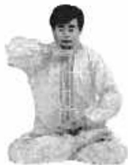
5 - 14

Vid det här tillfället är handflatorna vända mot varandra, håll den stilla positionen (se fig. 5-13).