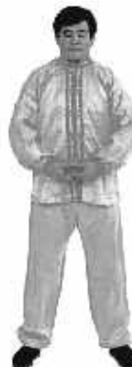
2 - 1

Sìmiào Sìwù, Fǎlún Chūqǐ. 似 妙 似 悟, 法 轮 初 起。