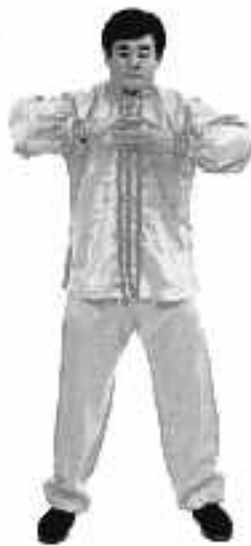
4 - 9